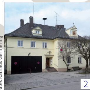
2 Altes Rathaus Germering