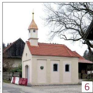
Marienkapelle Nebel 6