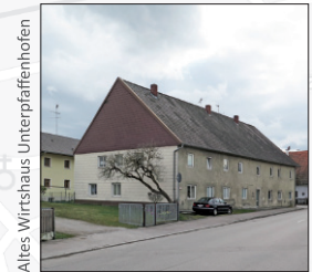
Altes Wirtshaus Unterpaffenhofen

Hinweis: Dieses Faltblatt wird vom Förderverein Stadtmuseum Germering e.V. gemeinsam mit der Stadt Germering herausgegeben. Für die Richtigkeit der Angaben und das gefahrenlose Benutzen der Wege wird keine Haftung übernommen.