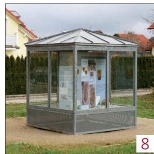
8 Museumseinheit „Steinzeit“