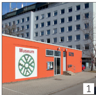
1 ZEIT+RAUM Museum

Archäologisch-historische Rundwege Germering